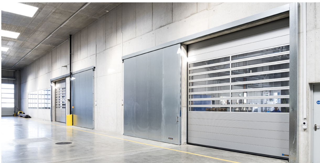
Stahl-Feuerschutz-Schiebetore FST EI30 Stahl-OD und Spiraltor HS 7030 PU 42