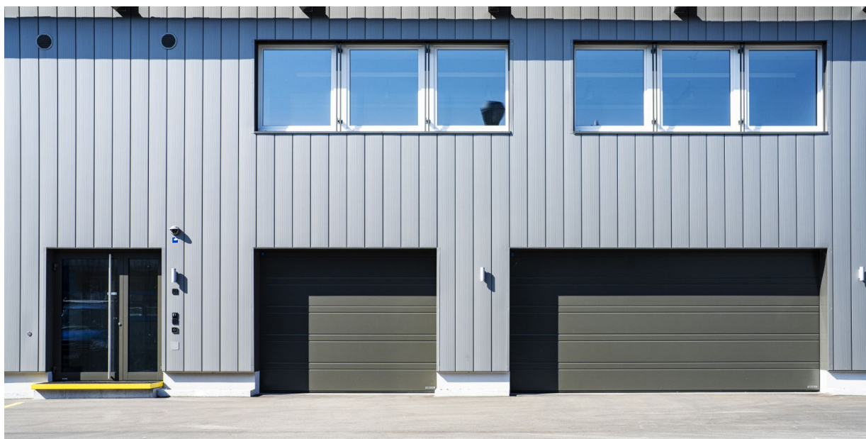
Garagen-Sektionaltore LPU 42 mit D-Sicke und Aluminium Haustür TC-80