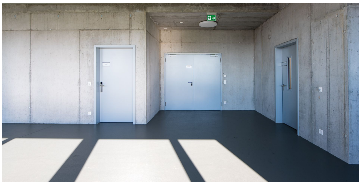
Stahl-Feuerschutztüren STU-1 Ei2 30 C und Stahl-Feuerschutztür STU-2 Ei2 30 C